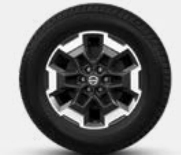
18" ALLIAGE (Grade LE Plus)