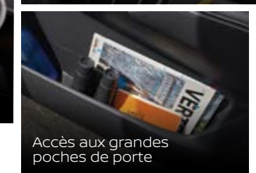
Accès aux grandes poches de porte

*DISPONIBLE SUR DES MODÈLES SÉLECTIONNÉS.