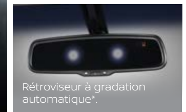
Rétroviseur à gradation automatique*