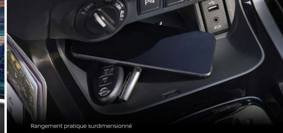
Rangement pratique surdimensionné

La forme rencontre la fonction lorsque vous découvrez comment la cabine du Navara a été soigneusement conçue pour s'intégrer parfaitement à chaque moment, que ce soit pour le travail, les loisirs ou la détente. Des espaces de rangement généreux, un rangement pour lunettes de soleil, une boîte à gants surdimensionnée et de multiples points de charge font du tout nouveau Navara le compagnon idéal pour la vie quotidienne.