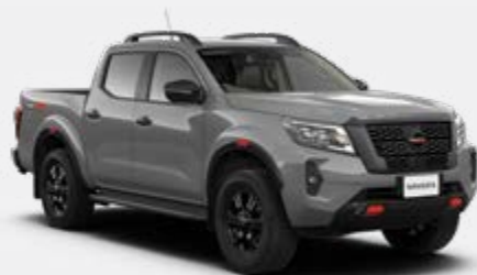
Gris guerrier (PM) - KBY Disponible uniquement sur les modèles PRO-4X.