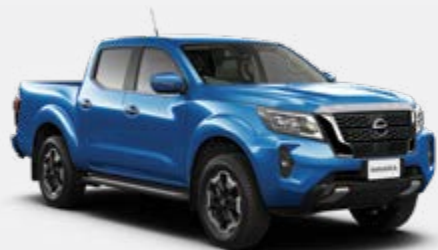
Bleu (M) - B16