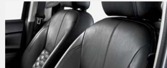
SIÈGES EN CUIR NOIR (Modèle LE Plus)