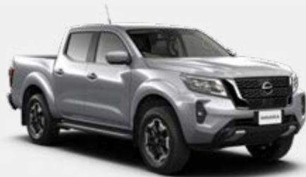
Argent (M) - KY0