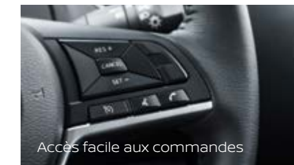
Accès facile aux commandes

Le Navara optimise le rangement à l'intérieur comme à l'extérieur. Les sièges arrière offrent un espace de rangement sécurisé sous le siège et peuvent être relevés pour faciliter le transport d'objets plus hauts.