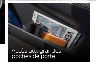
Accès aux grandes poches de porte

*DISPONIBLE SUR DES MODÈLES SÉLECTIONNÉS.