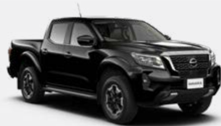
Noir Infiniti (S) - KH3