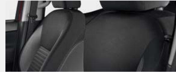
SIÈGES EN TISSU (Modèles LE, SE Plus et SE)