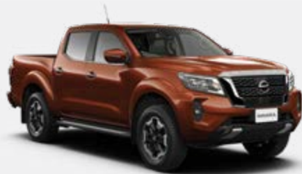
Cuivre forgé (M) - CAU