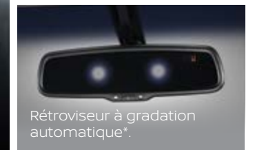
Rétroviseur à gradation automatique*