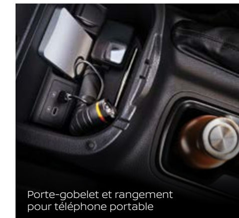
Porte-gobelet et rangement pour téléphone portable