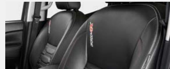
SIÈGES EN CUIR NOIR (Modèle PRO-4X)