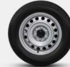
16" PO EN ACIER (CAB SIMPLE)