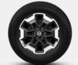
18" ALLIAGE (Grade LE)