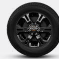
17" ALLIAGE (PRO-2X et PRO-4X)

Nl'engagement de Nissan en matière de qualité: Pour offrir à tous ses clients un niveau de qualité élevé et constant, Nissan applique les mêmes normes dans le monde entier, afin de garantir à tous les propriétaires de Nissan la tranquillité d'esprit pendant toute la durée de vie de leur véhicule. Cette approche est fondée sur la qualité du point de vue du client sur trois éléments clés : Premièrement, l'attente d'une expérience de conduite fluide en toute tranquillité d'esprit. Deuxièmement, l'attrait intangible d'un véhicule, son pouvoir de captiver et d'exciter, avec des caractéristiques qui captent l'attention et l'imagination. Troisièmement, le niveau d'attention et de service pendant le processus de vente, et longtemps après la conclusion de la vente.