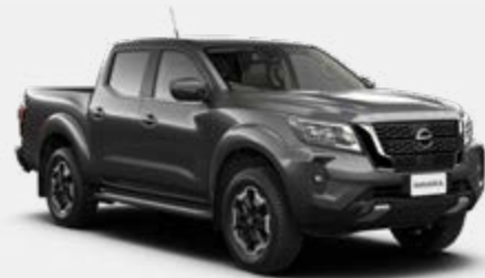
Gris Techno (M) - KY5