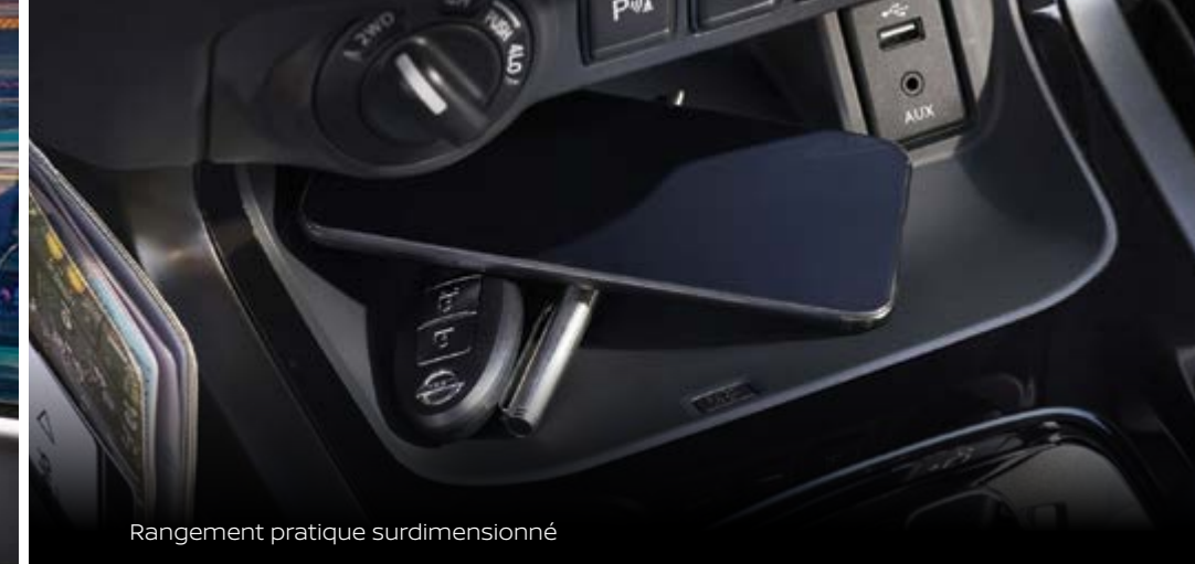
Rangement pratique surdimensionné

La forme rencontre la fonction lorsque vous découvrez comment la cabine du Navara a été soigneusement conçue pour s'intégrer parfaitement à chaque moment, que ce soit pour le travail, les loisirs ou la détente. Des espaces de rangement généreux, un rangement pour lunettes de soleil, une boîte à gants surdimensionnée et de multiples points de charge font du tout nouveau Navara le compagnon idéal pour la vie quotidienne.