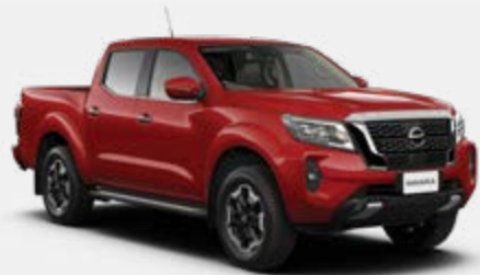
Rouge (S) - AX6